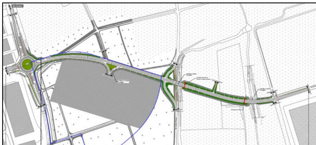
Progetto esecutivo del tracciato della nuova tangenziale