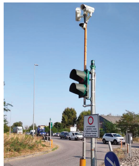
Le telecamere di sicurezza installate in area "Pizzabrasa" (a sinistra) e in via Benessere (a destra)